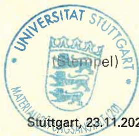
Dr.-Ing. D. Lotze Leiter der Zertifizierungsstelle

Dieses Zertifikat wurde erstmals am 25.07.2017 ausgestellt und bleibt gültig, solange weder die ETA, das EAD, das Bauprodukt, die AVCP-Methoden noch die Herstellbedingungen im Werk wesentlich geändert werden, es sei denn, das Zertifikat wurde von der notifizierten Zertifizierungsstelle für die werkseigene Produktionskontrolle ausgesetzt oder zurückgezogen.